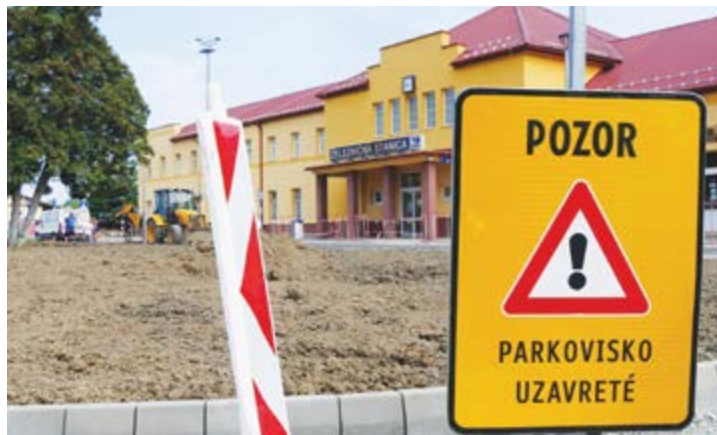
text a foto: Filip Mózér

Plánovaný termín ukončenia výstavby je 30. jún 2023.