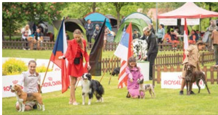
text a foto: Ivica Hromádková

Okrem titulov šampiónov sa ťažilo aj o najkrajšiu dvojicu Chovateľ a pes, a takisto mali šancu aj