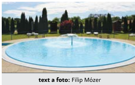
text a foto: Filip Mózer

Mestské kúpalisko v Lučenci bude otvorené každý deň od 9:00 do 19:00.