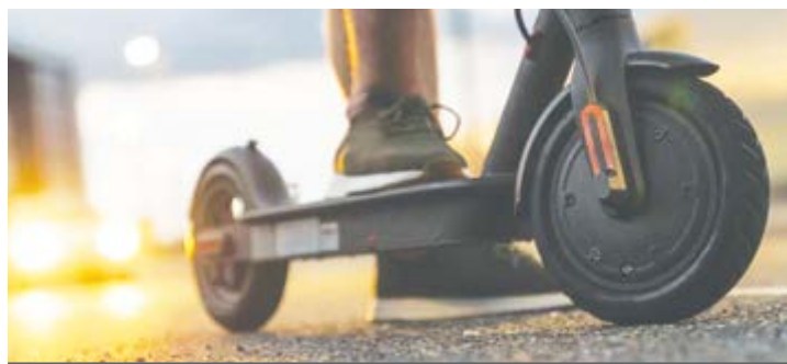
text: Mestská polícia Lučenec