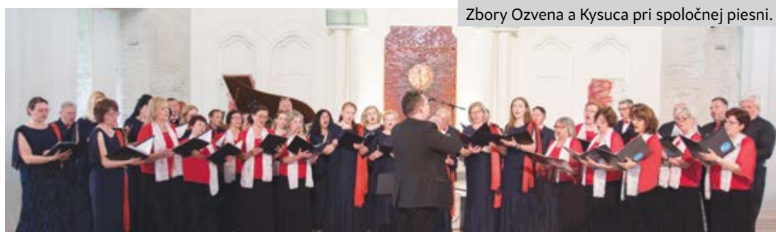
Zbory Ozvena a Kysuca pri spoločnej piesni.